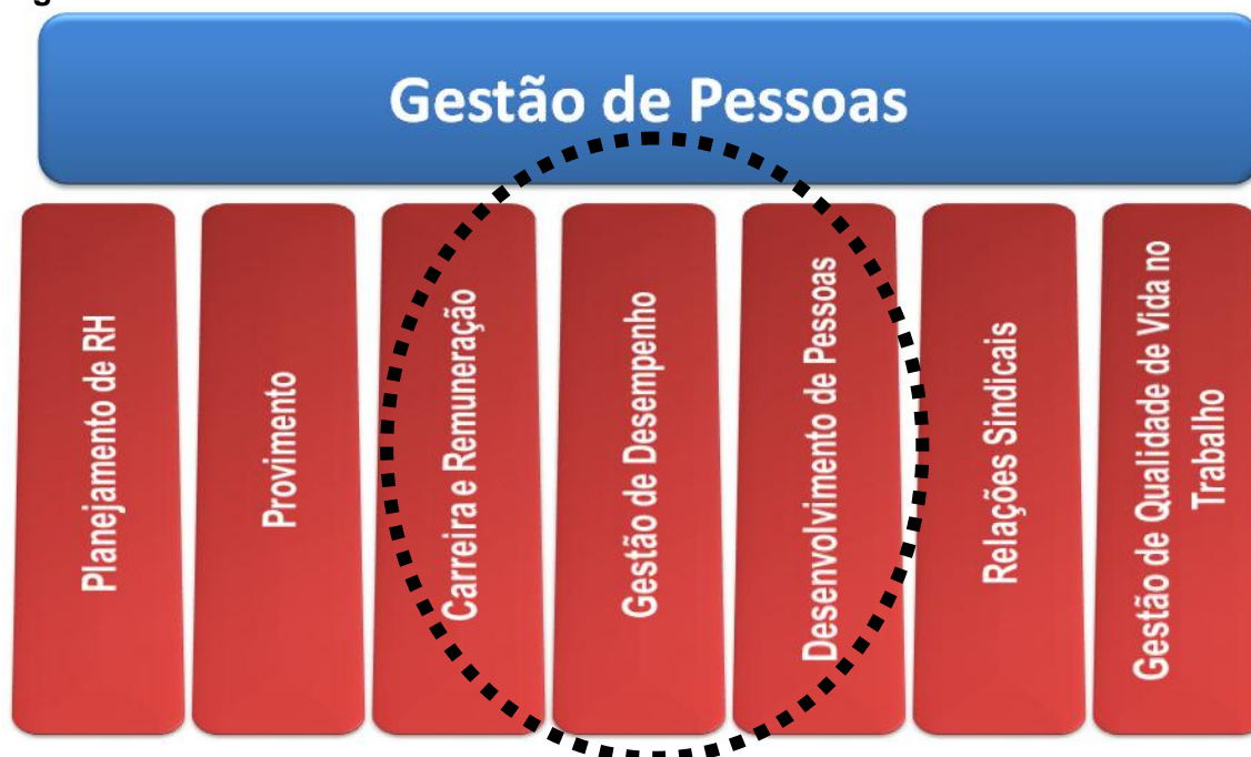
Figura 2 – Gestão de Pessoas

O modelo de gestão das carreiras do Governo do Estado do Espírito Santo passou nos últimos oito anos por uma transformação relevante, uma vez que variáveis importantes de sua estrutura foram mudadas.