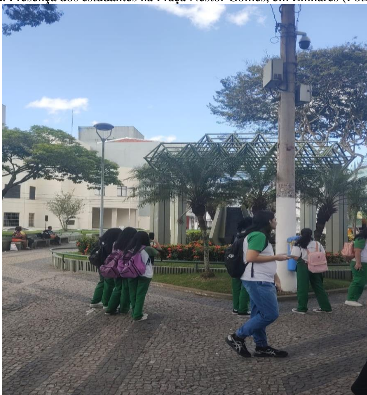
Imagem 2. Presença dos estudantes na Praça Nestor Gomes, em Linhares (Foto do autor).