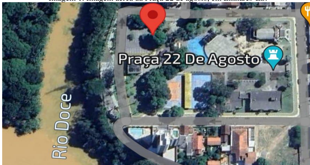
Imagem 1. Imagem aérea da Praça 22 de agosto, em Linhares-ES.

Um dos pontos relevantes da praça a favor da nossa pesquisa é a quantidade de vegetação presente no interior e arredores dela, inclusive, um de seus lados é margeado por um braço do rio doce como mostra a Imagem 1.