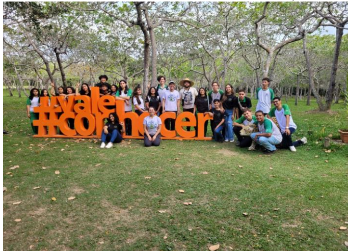
Imagem 3. Presente dos estudantes na Reserva Natural Vale, em Linhares-ES.

Portanto, a observação de aves na Reserva Natural Vale é mais do que apenas um passatempo - é uma atividade que beneficia tanto as aves quanto as pessoas, e desempenha um papel vital na conservação do nosso precioso ambiente natural.